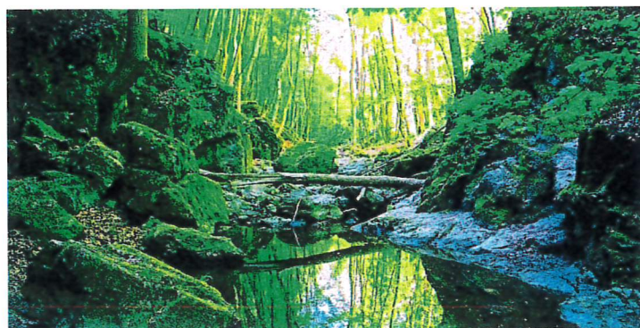
A Bakony szívében