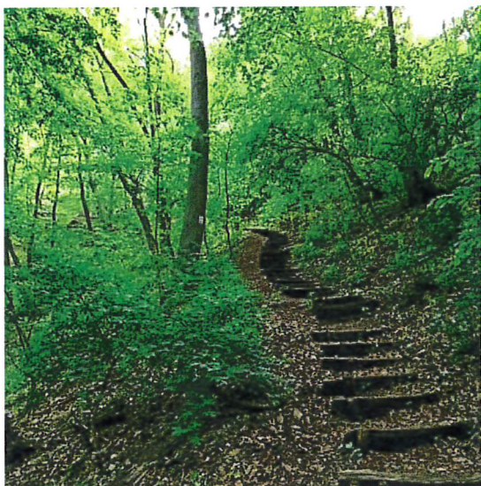
Barangolás a Vértesben

GYERMEKVÉDELMI KÖZPONT ÉS ÁLTALÁNOS ISKOLA KOMÁROM-ESZTERGOM VÁRMEGYE 2840 Oroszlány, Rákóczi F. út 53. Telefon: (06 34) 361 041, info@oroszlanygyo.hu